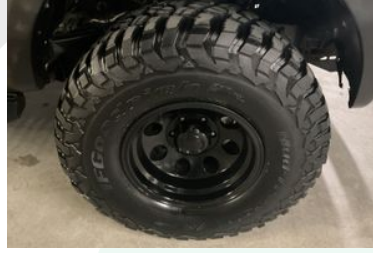
Sağ Ön Lastik