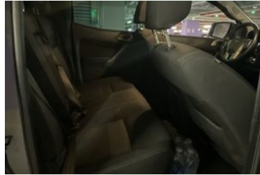
8. Araç için sağ arka sıra