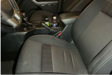
KOLTUK DÖŞEMELERİ VE AYAR DÜĞMELERİ