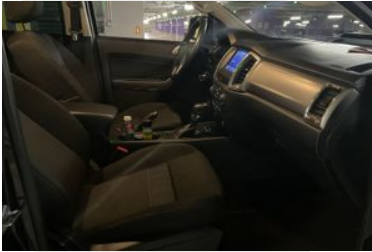
7. Araç için sağ ön sıra