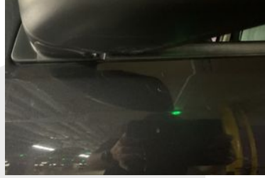
SOL ÖN KAPI