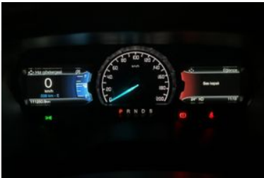
11. Araç için kadran