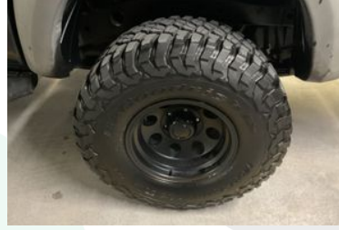
Sol Arka Lastik