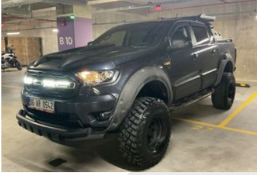
1. Sol Ön Çapraz