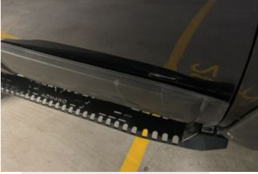
SAĞ ÖN KAPI