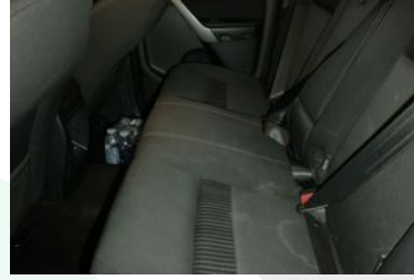
KOLTUK DÖŞEMELERİ VE AYAR DÜĞMELERİ