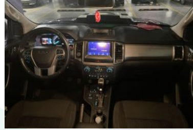
6. Araç için ön konsol