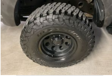
Sağ Arka Lastik