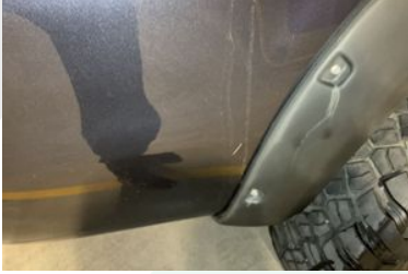
SAĞ ARKA ÇAMURLUK