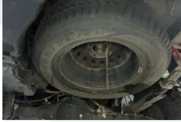
STEPNE VEYA TAMİR KİTİ