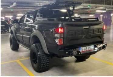
4. Sol Arka Çapraz