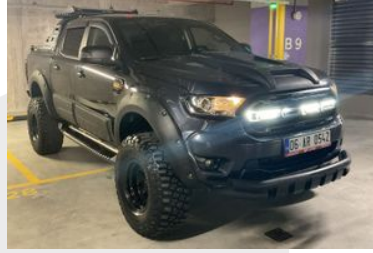
2. Sağ Ön Çapraz