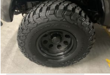
Sol Ön Lastik