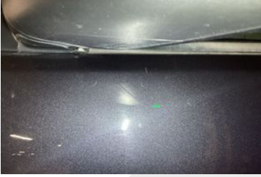
SOL ÖN KAPI