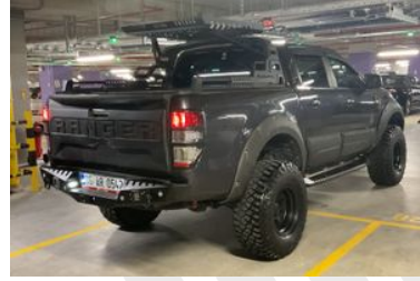
3. Sağ Arka Çapraz