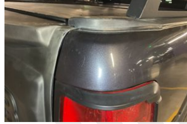
SAĞ ARKA ÇAMURLUK